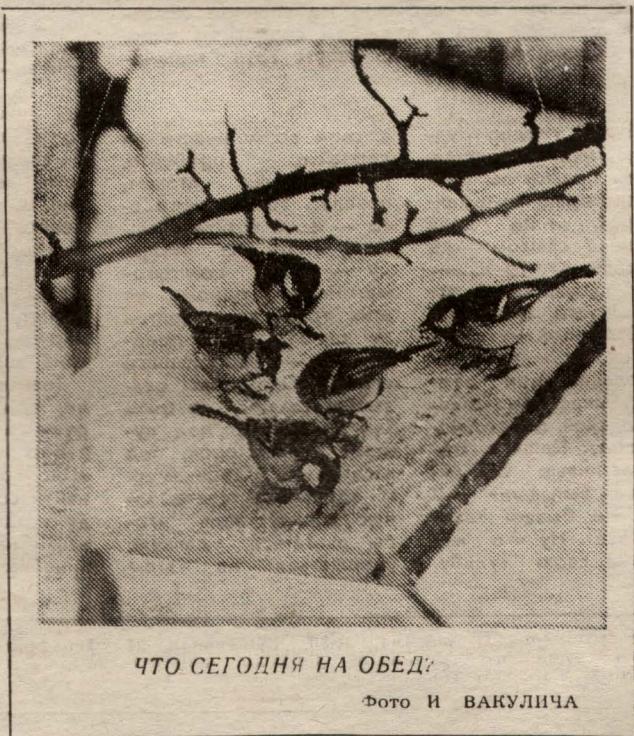
ЧТО СЕГОДНЯ НА ОБЕД: